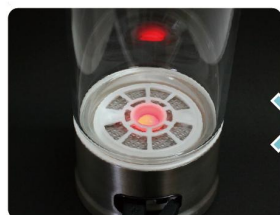
紅色 LED 是代表充電開始。