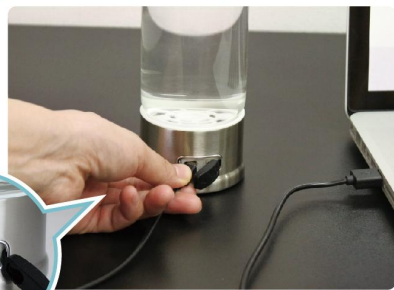
打開矽膠的蓋會看到充電的 USB 接頭！