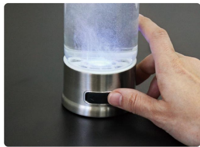
連續按下右邊的電源按鈕兩次，就會開始 4 分鐘製作水素水。