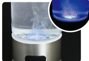
藍色 LED 是代表開始製作水素水。 水素水製作完成後，LED 會熄滅。