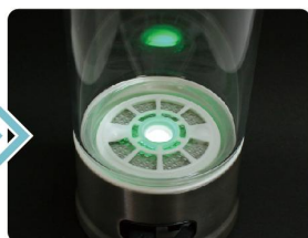
綠色 LED 是代表充電完成了。